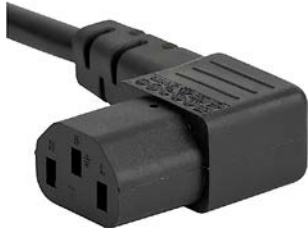
IEC Gerätesteckdose C13 abgewinkelt schwarz

Anschlussleitung mit IEC Gerätesteckdose C13 abgewinkelt, abisolierte Kabelenden