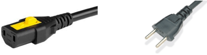
Netzstecker Schweiz schwarz

CH Anschlussleitung mit IEC Gerätesteckdose C17, V-Lock, gerade